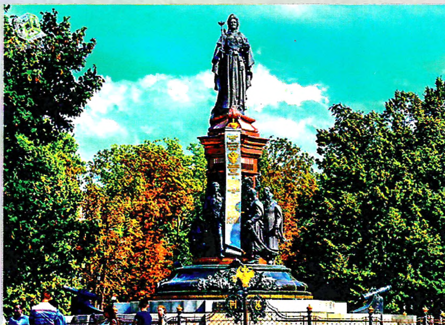
Краснодар, 2023 г.